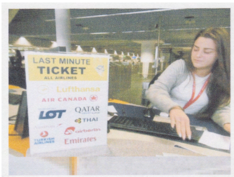
* フランクフルトの高額チケット売り場

カウンターの近くに当日出発の航空券の販売カウンター発見。売っているチケットは片道30万円台の高額チケット。こんなチケット買えないよ～。私の往復チケットはPCで買ったエアチャイナの格安。スマホでのチケット予約の経験はない。