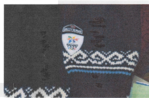
*ノルウエーのバイアスロンチームからのプレゼント