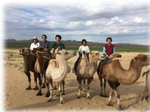
2019年7月 モンゴル開催の東アジア会議 参加のあと、九州サーバスの仲間と

昨年盛會に終わった宮崎での秋例会ですが、過去の資料があったので掲載します。秋のお楽しみ例会、九州内で各県を転々とめぐるのも楽しそうですね。観光もそうですが、何よりも会員同士の交流が最高だと思います。各県の会員間で話し合っ、「ここを紹介したい…」と進んで手を挙げていただくと幸いです。