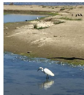
L さんの Facebook より