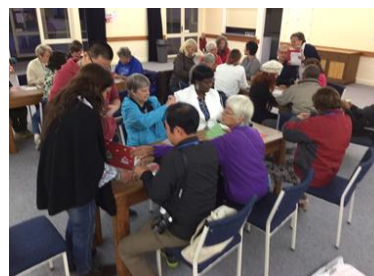
好評を博した日本の 夕べの折り紙教室