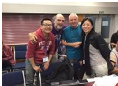
東アジアサーバスの新しい顔。 左端は中国のJ.H 右端は台湾のW.M