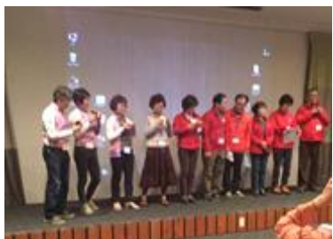
ポーランド大会のTさんに触発されたか韓国チームのオカリナ伴奏によるアリラン

し」というトシデモ提案があったので、「アホか。さっさとカウチサーフィンへ行っちゃまえ」と発言しようと思ったのですが、オーストラリア代表が「ホストはいかなる状況下にあっても評価されるポジションにはない」旨を理路整然と述べてその議案をボツにしました。